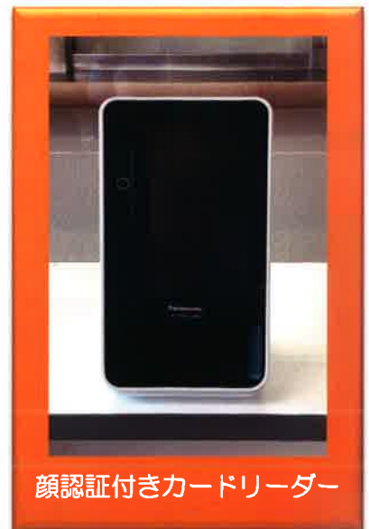
顔認証付きカードリーダー